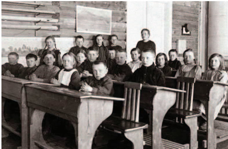
Sodankylän Torvisen kansakoulun oppilaita joskus vuosien 1924–26 välillä.

Suomalaisen perusopetuksen alkuajoista lähtien periaatteena on ollut, että koulut ovat lähellä oppilaita. Vuoden 1898 piirijakoasetuksen jälkeen asetettiin tavoitteeksi Mikael Soinin ohjelma, jonka mukaan jokaisessa kylässä tuli olla koulu. Asetuksen mukaan kuntien tuli jakaa alueet koulupiireihin, jottei koululaisten koulumatka olisi viittä kilometriä pitempi. Asetuksen ansiosta koulujen määrä alkoi kasvaa, ja pian miltei joka kylällä oli oma koulunsa. Vuoden 1921 oppivelvollisuuslain myötä koulujen perustamisen tarve kasvoi edelleen. Lapsia oli paljon, kulkuyhteydet olivat heikkoja ja kulkuvälineet alkeellisia. 1950-luvulla suuret ikäluokat tulivat kouluikänsä. Kun asutus oli levinnyt asutustilojen myötä pitäjien eri osiin, tarvittiin paljon uusia kouluja. Tästä alkoikin kyläkoulujen ennennäkemätön määrällinen kasvu. (Kuikka 1996.) Koulujen lukumäärä lisääntyi aina 1950-luvun puoliväliin saakka.