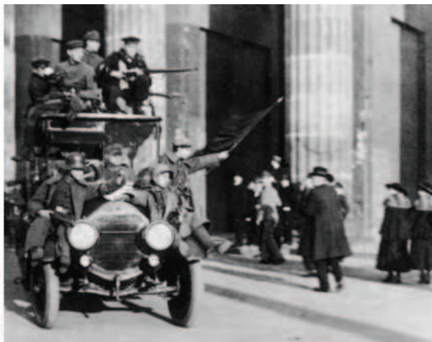
Puheiden taustaa. Vuosi 1917: Saksalaisten kaasuhyökkäys (vas.). Marraskuu 1918: Vallankumouksellisia Berliinissä.

Tekstejä voi lukea jo sellaisenaan. Luentoihin perehtymistä kuitenkin auttaa, kun pidetään mielessä se historiallinen ympäristö ja yhteiskunnallinen asetelma, joissa ne on pidetty. Ensiksi on huomattava, että molemmissa luennossa järjestäjätaho on sama, nimittäin Mün- chenissä toimiva Vapaiden ylioppilaiden liiton (Freistudentischer Bund) Baijerin osasto. Vapaiden ylioppilaiden liitto oli nykyisten ylioppilaskuntien edeltäjä, joka tuohon aikaan oli jo syrjäyttänyt aiemmat, aatelisarvoon tai sotilaspalvelukseen perustuvat opiskelijoiden yhteenliittymät (ks. Hietaniemi 2009, 9–10). Edeltäjistään poiketen vapaiden ylioppilaiden liitto rajasi toimintansa akateemisiin kysymyksiin, kuten opiskelijoiden sosiaalisen aseman parantamiseen ja opetuksen ja oppimisen vapauden edistämiseen.