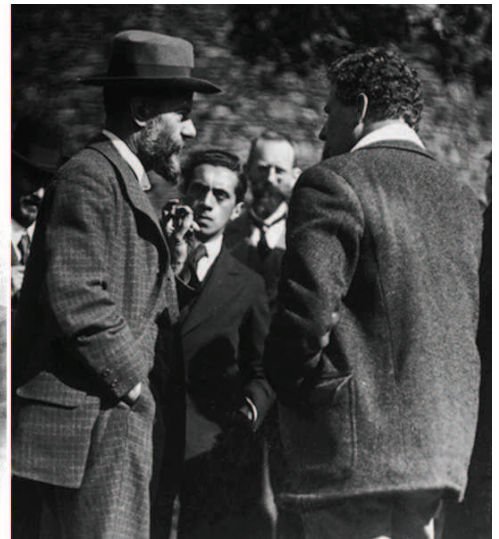
Max Weber vuonna 1878, 1894 ja 1917.