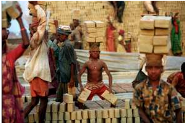
Kuva 5. UNICEFin (2007) sponsoroimassa ”vuoden valokuva” -kilpailussa toiseksi tullut otos.

Oikeutta kenelle ja kenen lapsuutta tukemassa? - Lapsen oikeuksien sopimuksen 12. artiklaa, ns. osallisuuspykälää, on käytetty ahkerasti viimeaikaisen lapsi- ja nuorisopolitiikan suuntaamisessa ”osallistavampaan” suuntaan. Artiklan mukaan lapsella, joka kykenee muodostamaan omat näkemyksensä, on oikeus ilmaista vapaasti nämä näkemyksensä kaikissa itseään koskevissa asioissa. Sopimuksen mukaan lapsen näkemykset tulee ottaa huomioon hänen ikänsä ja kehitystason mukaisesti. Tämän toteuttamiseksi lapselle on annettava mahdollisuus tulla kuulluksi häntä koskevissa oikeudellisissa ja hallinnollisissa toiminnaissa joko suoraan tai edustajan/asianomaisen toimielimen välityksellä, kansallisen lainsäädännön menettelytapojen mukaisesti.