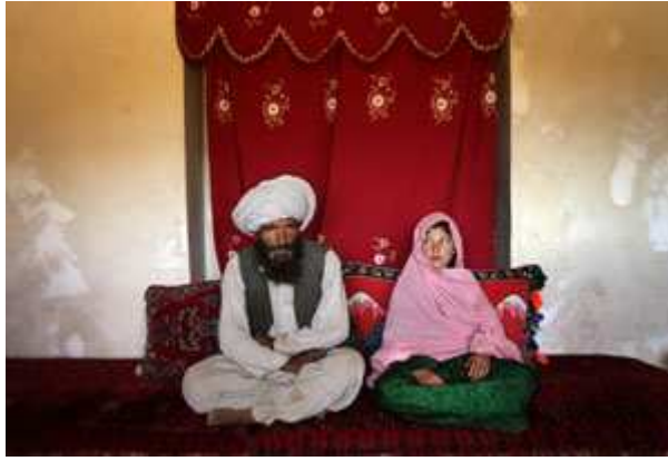
Kuva 4. UNICEFin (2007) sponsoroiman ”vuoden valokuva” -kilpailun voittaja vuodelta 2007.